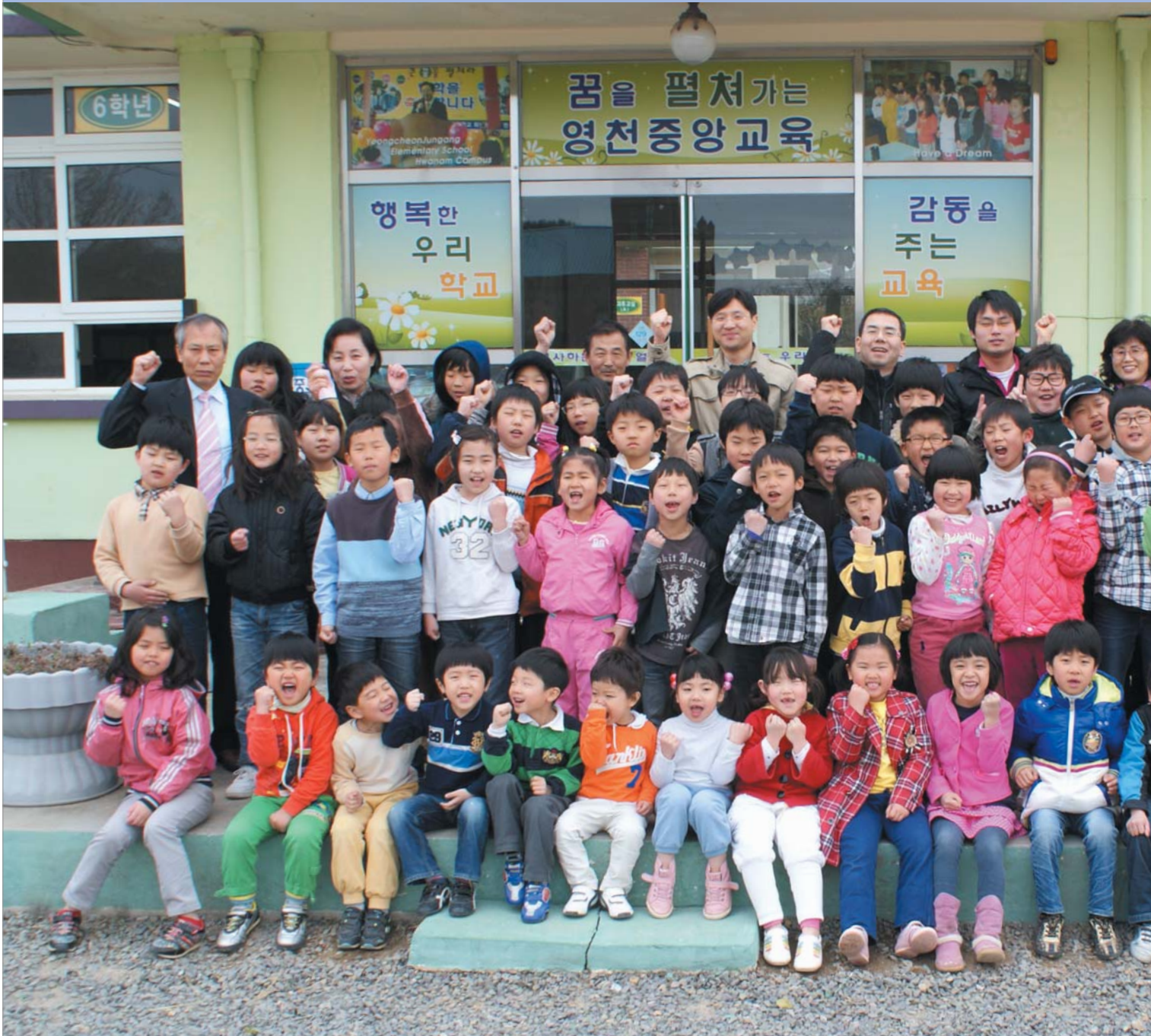
화려한 부활! 영천중앙초등학교 화남분교장 어린이들!