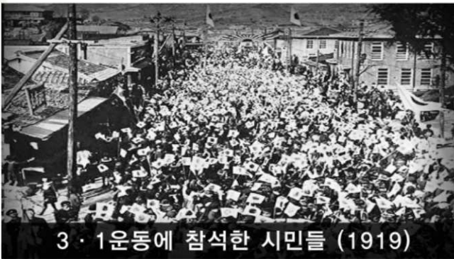
3·1운동에 참석한 시민들 (1919)

3·1 운동에 나타난 독립정신을 계승하여 우리 민족의 단결을 굳게 하고, 국민들의 애국심을 기르기 위하여 정한 기념일입니다.