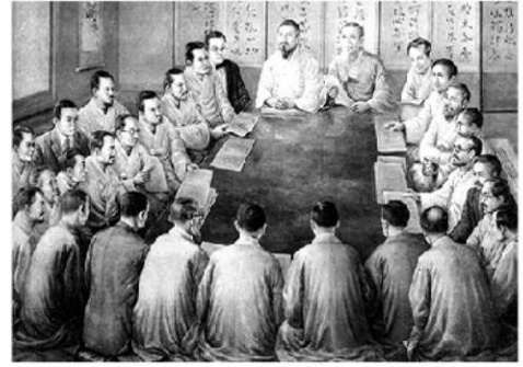
민족 대표 33인