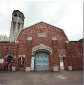
제암리 학살 사건

일본 군경들은 만세운동이 일어난 제암리에서 마을 주민들을 교회에 가두고 불을 질러 30여 명을 학살하였다.